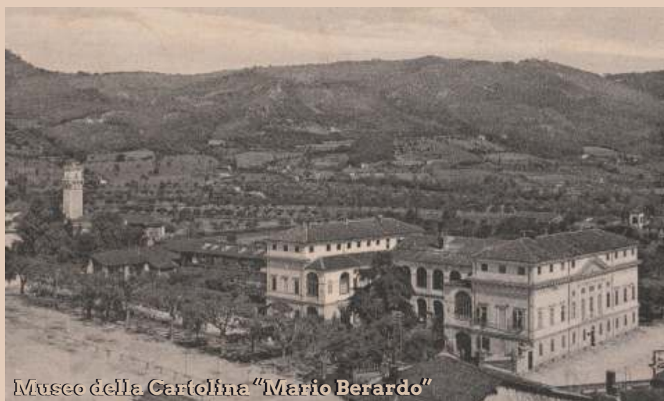
Museo della Cartolina "Mario Berardo"

L'ente conta di attivare entro nel 2026 il BONUS ART che è un credito di imposta, pari al 65% dell'importo donato da ditte e privati a sostegno del patrimonio culturale pubblico.