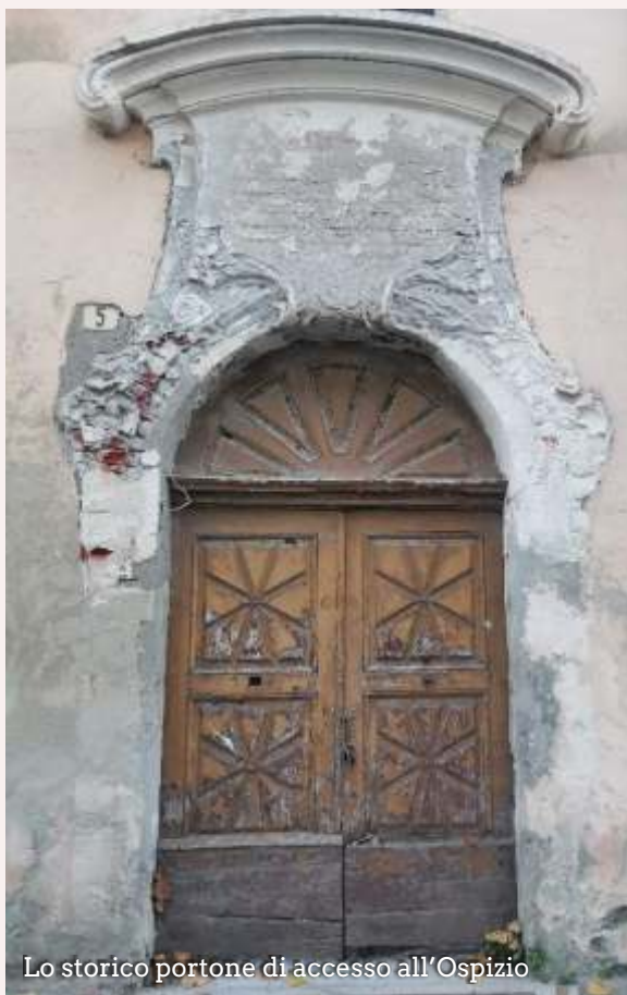
Lo storico portone di accesso all'Ospizio

Aiutateci a trasformare l'Ospizio in un luogo nuovamente vivo, accogliente e colmo di umanità. Insieme possiamo ridare valore e calore a chi, con la propria vita, ha costruito il nostro presente.