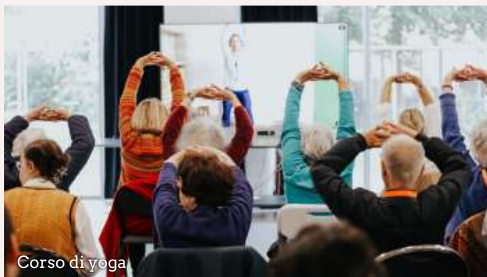
Corso di yoga

Milano, 1950. L'ingegnere britannico Charles Holland, ex maggiore dell'esercito del Regno Unito attivo nella Resistenza italiana, ha una missione: aiutare le persone che hanno subito danni all'udito a causa dei bombardamenti della seconda guerra mondiale. Così nasce Amplifon. Da un piccolo laboratorio nel centro di Milano, in pochi anni, l'azienda cresce rapidamente, espandendosi prima in Italia e poi all'estero fino a diventare leader nel mercato dei dispositivi acustici. Oggi, dopo 75 anni di innovazione e di eccellenza, Amplifon è il punto di riferimento mondiale nella cura dell'udito con oltre 10.000 negozi e più di 20.900 persone in 26 Paesi.