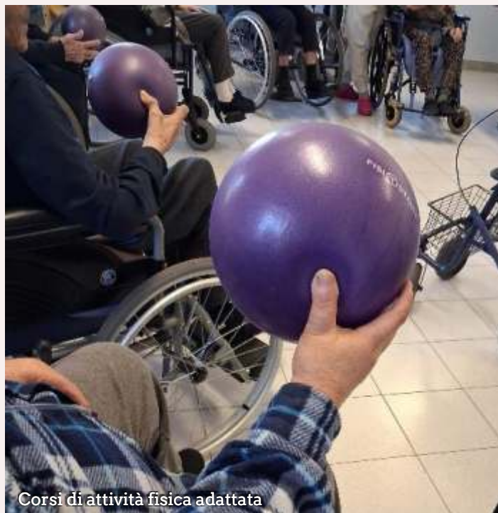
Corsi di attività fisica adattata